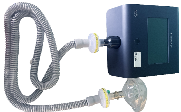
Tilbehør koblet til maskinen.

Du har nu et samlet slangesystem, som kan kobles på maskinen.