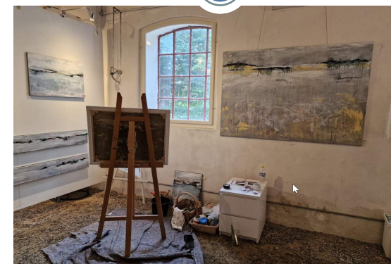
Besøg hos kunstner