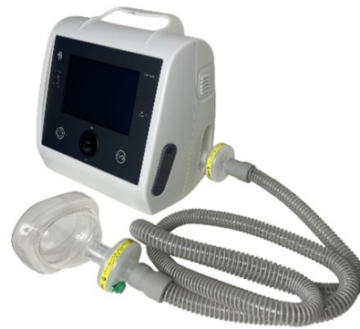
Samlet tilbehør koblet til maskinen

Du har nu et samlet slangesystem, som kan kobles på maskinen.