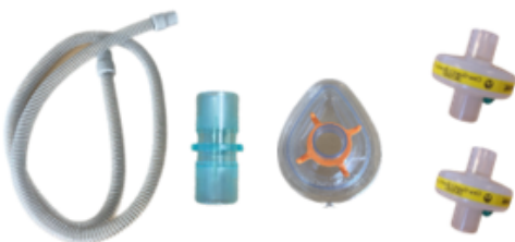
Slange, samlestykke, maske og bakteriefiltre