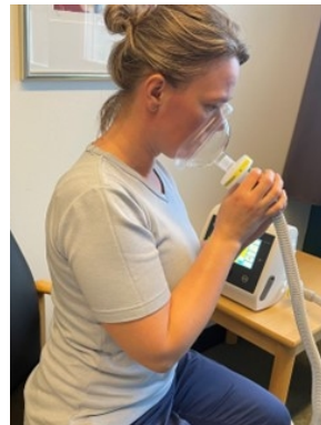
Sådan kan du holde masken selv.

Får du hjælp af en pårørende eller hjemmeplejen, kan de holde masken, hvor de har tommelfingeren på den ene side af midten og de resterende fingere på den anden side.